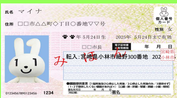
おもて面はあなたの顔写真入り