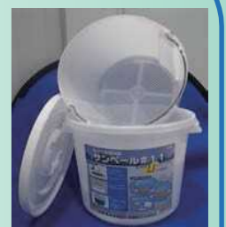
Xô làm ráo nước (dùng cho gia đình)

※ Trước khi mua xin hãy xác nhận với cửa hàng xem còn hàng trong kho hay không