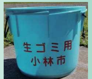
Thùng đựng rác tươi tại điểm tập kết rác

Về xô làm ráo nước thì là một cái cho mỗi hộ gia đình và chỉ phát miễn phí cho những người nhận lần đầu. Từ cái thứ 2 trở đi sẽ là tự trả phí để mua (Không có chỉ định gì đặc biệt).