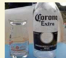
Chai mà có in chữ trực tiếp trên đó.