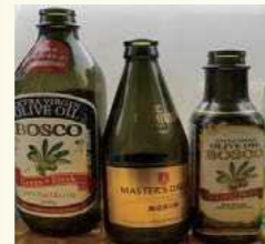
Chai có màu nâu