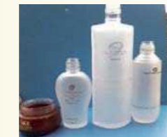
Chai lọ đựng mỹ phẩm