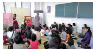
昨年のおひなまつりの様子