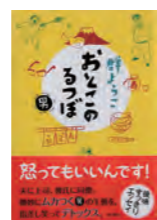
「おとこのつぼ」 著者：群 ようこ