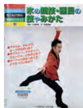
「氷の競技・種目の技やみかた」 監修：大熊 廣明 文：稲葉 茂勝