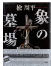
「象の墓場」 著者：楡 周平