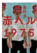
「赤ヘル 1975」 著者：重松 清