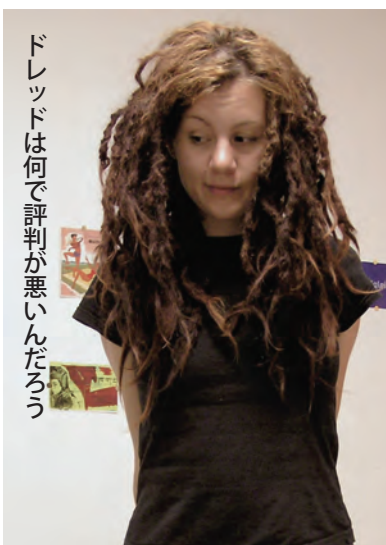
ドレッドは何で評判が悪いんだろう

15年間ってなかなか長い時間ですよ。15年ぶりに、髪の毛を染めなくなったんです。自分でも地毛はどんな色か分からなくなっていました。サーフィンで自然にブリーチされた髪以外、地毛に戻ってます。そして、なんと!!!お兄ちゃんと同じ色をしていることが昨年末ドイツに帰った時に分かりました。生まれた時は黒で、4歳の頃は金髪で、その後はまただんだんと暗くなってきました。