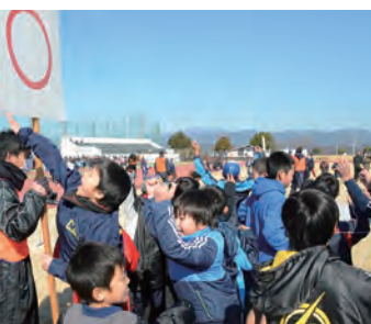
ロードレース後の、〇×ゲームで正解して喜び子ども達