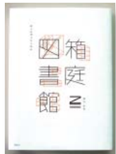
『箱庭図書館』 著者：乙一