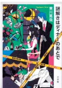
『謎解きはディナーのあとで』 著者：東川 篤哉

5月の開館時間と休館日 【本館】 1日と毎週月曜 開館時間：9時～19時 日曜および祝日は17時まで 【須木分館・野尻分館】 1日と毎週月曜・祝日 開館時間 ◆須木：9時～17時 ◆野尻：10時～18時30分 ※日曜は17時まで