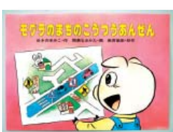
『モグラのまちのこうつうあんぜん』 作：ゆきの ゆみこ