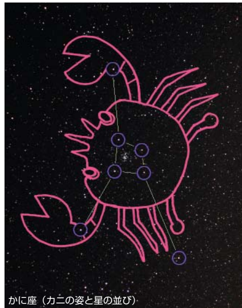
かに座 (カニの姿と星の並び)

【表・文・東修一】 まったり姿から お馬さんの餌 入れ「飼い葉桶 星団」と呼ぶこ ともあります。 星粒を餌に見 立てると面白 い眺めになり ますよ。