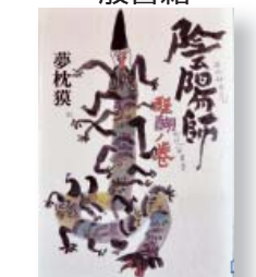
『陰陽師 醍醐ノ巻』 著者: 夢枕獯