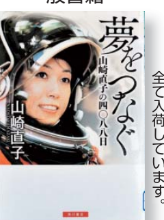
『夢をつなぐ』 山崎直子の四〇八八日 著者: 山崎直子

7月の開館時間と休館日 【本館】 1日と毎週月曜 開館時間: 9時~19時 日曜および祝日は17時まで 【須木分館・野尻分館】 1日と毎週月曜・祝日 開館時間 ◆須木: 9時~17時 ◆野尻: 10時~18時30分 ※日曜は17時まで