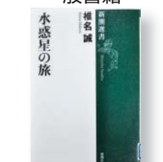
『水惑星の旅』 著者: 椎名誠