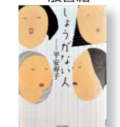
『しょうがない人』 著者: 平安寿子