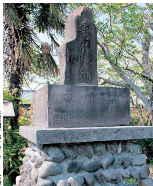
▶紙屋関所跡に建立された石碑

紙屋関所跡は、紙屋小学校北側の市道を挟んだ向かい側にある、薩摩藩に設置された番所(関所)の一つです。薩摩藩は、他領との境界、海や河川の港における重要な箇所に番所を設け、通行人や荷物の検査を行っており、その厳重さは他藩に例を見ないほどでした。