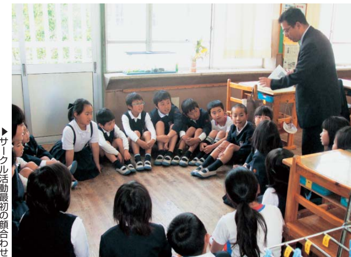
▶サークル活動最初の顔合わせ

南 小学校は、小林市のほぼ中心部に位置する全校児童318名の学校です。学校の教育目標は、「自ら学び、自ら思いやり、自ら鍛える子どもの育成」で、小林小学校・小林中学校とともに、三校の9年間を見通した目標として設定しています。