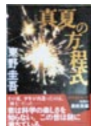
『真夏の方程式』 著者: 東野 圭吾