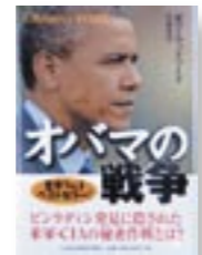
『オバマの戦争』 著者: ポブ・ウッドワード 翻訳: 伏見 威蕃