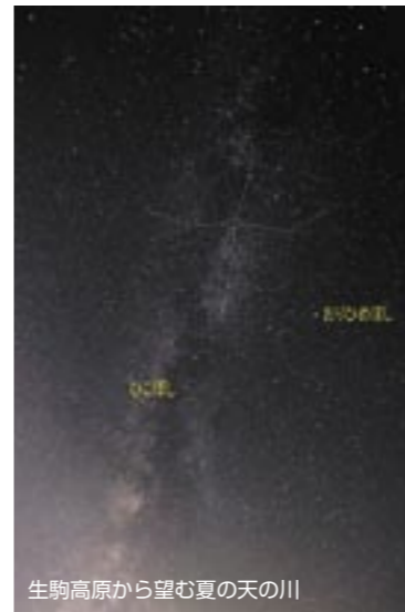
生駒高原から望む夏の夜の川

8月の開館時間と休館日 【本館】 2日と毎週月曜 開館時間: 9時~19時 日曜および祝日は17時まで 【須木分館・野尻分館】 2日と毎週月曜・祝日 開館時間 ◆須木: 9時~17時 ◆野尻: 10時~18時30分 ※日曜は17時まで