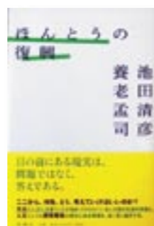
『ほんとうの復興』 著者: 池田 清彦・養老 孟司

8月の開館時間と休館日 【本館】 2日と毎週月曜 開館時間: 9時~19時 日曜および祝日は17時まで 【須木分館・野尻分館】 2日と毎週月曜・祝日 開館時間 ◆須木: 9時~17時 ◆野尻: 10時~18時30分 ※日曜は17時まで