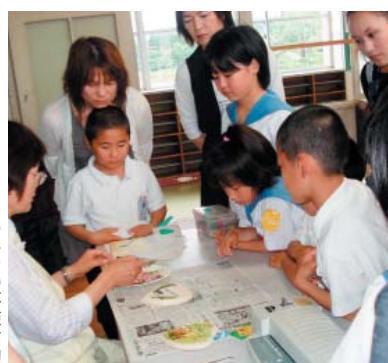
ふれあい体験活動

西 小林小学校は、全校児童177名の子どもの成長を願って、夢いっぱい(知育)、花いっぱい(徳育)、力いっぱい(体育・食育)の教育を推進しています。その中から、花いっぱい(徳育)に関する教育活動を紹介します。