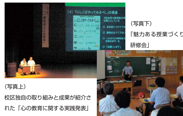
写真上 校区独自の取り組みと成果が紹介された「心の教育に関する実践発表」