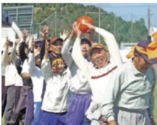
小林総合運動公園陸上競技場

スポーツの秋。今年も、小林大運動会が開催されます。スポーツのまち小林の名のとおり各地区対抗による熱戦の連続が期待されます。選手も応援団も笑顔になる団技や、手に汗握るリレー、全員参加の踊りなど盛りだくさんのプログラム。みんなを体を動かし、さわやかな汗を流しませんか。 ※プログラムは、当日会場で配布します。 開催日 10月9日(日曜) ※少雨決行・荒天中止 時間：9時～ 場所 小林総合運動公園陸上競技場