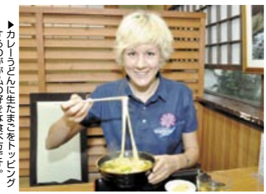
▶カレーうどんに生たまごをトッピングするのが私の好きな食べ方です。

皆 様、こんにちは。ドイツの食べ物といえば、ジャガイモという人が多いかもしれませんが。しかし、私はジャガイモがドイツの主食であるとは少し信じがたいです。なぜなら、私はジャガイモがあまり好きではないので、めったに食べないからです。よく考えてみると私の周囲の人もめったに食べません。 ドイツの食べ物といえば、もちろんジャガイモ以外にも色々あります。例えばパン。ドイツのパンは種類が多く、味はそれぞれです。パンは一般的に朝食や夕食に食べます。朝食は主にチヨコス