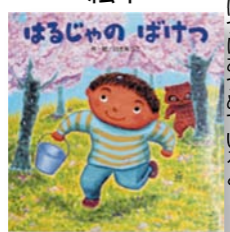
「はるじやの ばけつ」 作・絵:白土あつこ