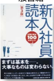
「新入社員読本 第3版」 編者:日本生産性本部