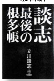
「談志最後の根多帳」 著者:立川談志