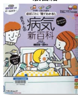
「赤ちゃんの病気新百科」 総監修:横田 俊一郎