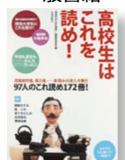
「高校生はこれを読め!」 編集:「高校生はこれを読め!」編集委員会