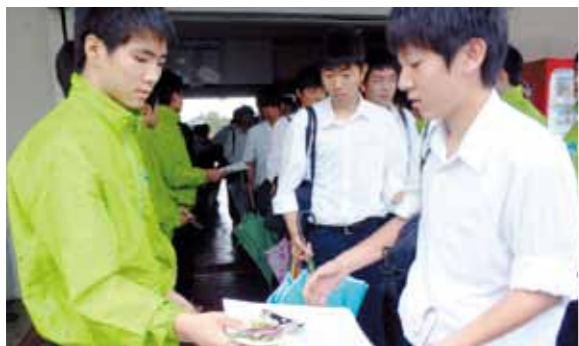
駅から出てくる学生などに元気にあいさつし、防犯を呼びかける秀峰高校新体操部

6月9日はロックの日。これを前にした6月8日、小林駅では防犯キャンペーンが行われました。警察や防犯協会、秀峰高校新体操部など約30人が参加。電車通学の学生に、チラシやグッズを配布し、自転車ロックの重要性や、自転車の安全運転を呼びかけました。宮崎県内では4月末現在で680台の自転車が盗まれており、1日平均にすると約6台。その多くが無施錠で中高生が被害にあっています。