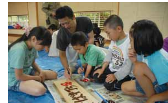
杉廃材を活用した板に、指導を受けながら名称を書く児童たち。出来栄は上部写真のとおり