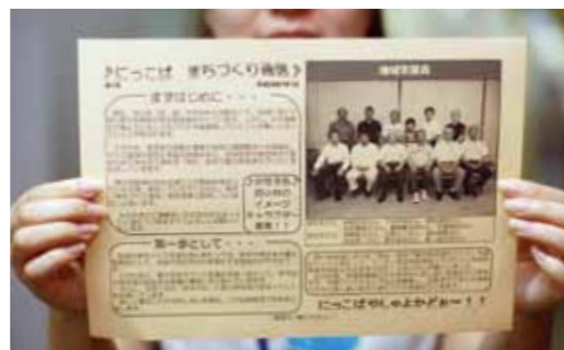
「にっこば まちづくり通信」はA4判で、両面に情報が満載です

また、西小林中校区では、9月1日(土曜)に西小林小で防災イベントを行う予定です。