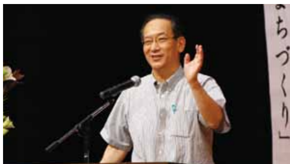
北川正恭早稲田大学政治経済学術院教授