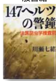
『147ヘルツの警鐘』 著者: 川瀬七緒