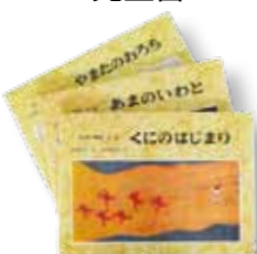
『日本の神話』 絵: 赤羽末吉 文: 舟崎克彦