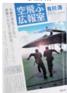
『空飛ぶ広報室』 著者: 有川浩