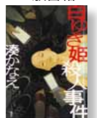
『白ゆき姫殺人事件』 著者: 湊かなえ