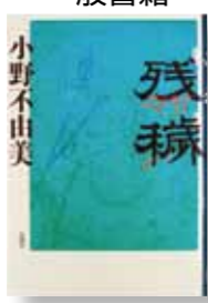
『残穢』 著者: 小野不由美