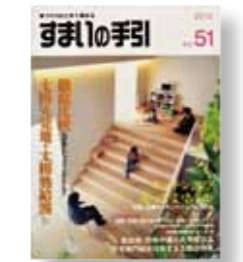
「すまいの手引」 発行：アース工房