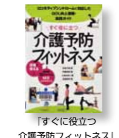
「すぐに役立つ 介護予防フィットネス」 著者：石井 千恵 他