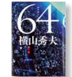
「64 (ロクヨン)」 著者：横山 秀夫