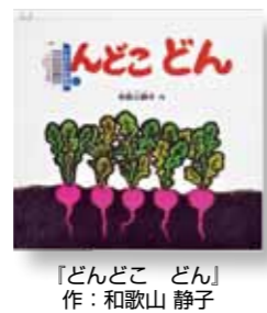
「どんどん」 作：和歌山 静子