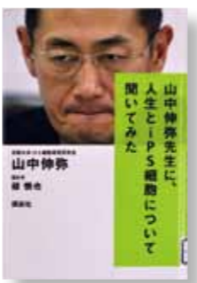
「山中伸弥先生に人生とiPS細胞について聞いてみた」 著者：山中伸弥・緑 慎也