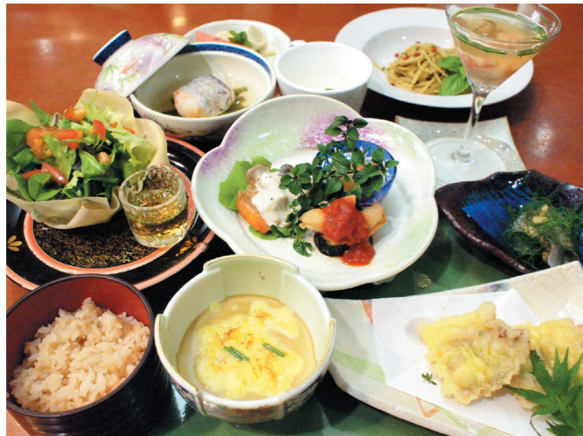
※写真はイメージです。季節により内容が異なります。