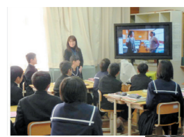
ICT活用推進モデル校研究発表会公開

東 方中学校は全校生徒59名で、生徒会執行部を中心にいろいろな活動をしています。今年、ICT活用推進モデル校研究発表会の公開があり、たくさんの先生や来賓が来られるということもありましたが、例年のごとく「授業前の立腰」や「校内外の環境美化」など活動をしてきました。特に、朝のボランティア活動で学校周辺や熊野神社の清掃活動を行い、さらに、2カ月に1回土曜日に行うボランティア活動で校内のワックスがけや窓ガラスなどの大清掃を2時間ほど行いました。 また、「花いっぱい運動」を実施しており、花を種から育てポットに移し替えながら苗に成長したものを花壇に植えたり、陽光の里（老人ホーム）に届けたりしています。12月下旬には、東方在住の一人暮らしのお年寄りに、みんなで育てた花をプレゼントしています。お年寄りの嬉しそうな顔を見ると、寒くて大変な時もあります。その他には、小・中・支援学校3校の東方大運