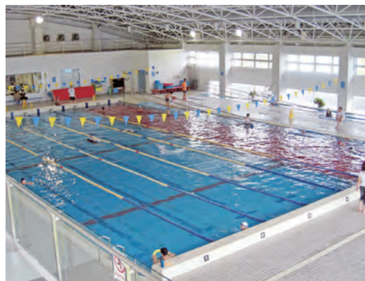
【上】室内プール 【右】児童用プール