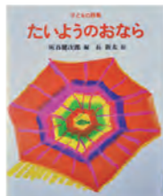
『たいようのおなら』 編：灰谷 健次郎 絵：長 新太