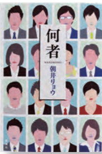
『何者』 著者：朝井 リョウ