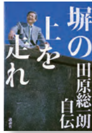
『堀の上を走れ』 著者：田原 総一郎