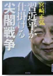
『習近平が仕掛ける尖閣戦争』 著者：宮崎 正弘