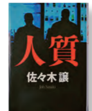
『人質』 著者：佐々木 譲