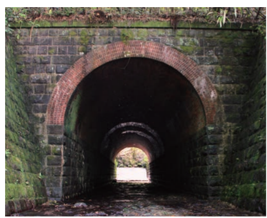
▲瀬久谷川暗渠(幅4.58m、長さ38.6m・湧水町般若寺地区)

「肥薩線を未来へつなぐ協議会」(湧水町、えびの市、人吉市を発起人として14市町村で構成)は、昨年4月、人吉市役所内に肥薩線世界遺産推進室を設置。肥薩線世界遺産に登録するための鉄道関連施設の調査や蒸気機関車D51の復活運行に向けた取組など、一大プロジェクトが本格的に始動しました。