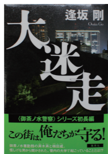
『大迷走』 著者: 逢坂剛