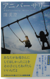
『アニバーサリー』 著者: 窪美登