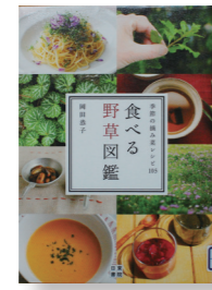
『食べる野草図鑑』 季節の摘み菜レシピ105 著者: 岡田恭子