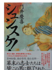
『シュンスケ!』 著者: 門井慶喜