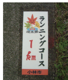
下/距離表示板 左/コース図

す きむらんどのかじかの湯をスタート地点としてランニングコースを整備しました。一本杉コース・片道12キロ(堂屋敷方面)と大いちょうコース・片道8キロ(九瀬方面)の2コースを設定。コースには、1キロごとに距離表示をしているので自分のペースで距離設定が出来ま