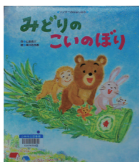
『みどりのこいのぼり』 作: 山本省三 絵: 森川百合香