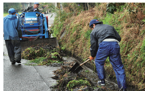
あいにくの雨の中、大量にたまった泥を側溝から上 げる参加者

News 吉都線 100周年記念事業 北西1区老人クラブと西小林 駅吉田名誉駅長に感謝状