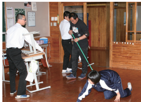
ほうきを止めない永久津中の掃除風景

永 久津中学校は、たくさん の木々や草花に囲ま れた、自然いっぱいの美しい 学校です。この素晴らしい環 境のなか、生徒全員が「誠心 誠意、一心不乱、切磋琢磨」 という校訓のもと充実した学 校生活を送っています。 私達の学校には、自慢でき ることがあります。清掃と立 ち止まりあいさつです。 永久津中学校の全校生徒は 38人しかいないため、先生方 に手伝っていただいても、校 舎全体を清掃するのはとても 大変で時間もかかります。そ こで、少人数でも素早く隅々 まで清掃を行えるように、私 たちの学校では「ほうきを止 めない」という独自の清掃を