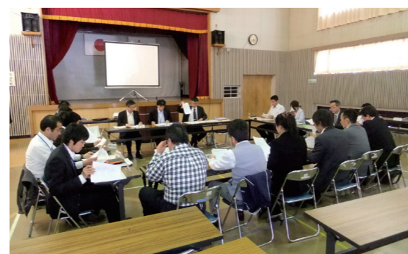
写真は研修会の様子