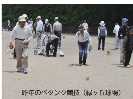
今年のベタンク競技(緑ヶ丘球場)

今 年もみやざき県民総合 スポーツ祭が開催され ます。県総合運動公園をはじ め県内各地で49の競技と9の 交流競技が開催されます。 小林市からは、29の競技に 選手、役員約750人が参加 し、大会の目的である健康の 増進、体力の向上はもちろん のこと、県内の方との親睦を 図ります。 小林市ではベタンク競技と トランポリン競技が開催され ます。 ・ベタンク 6月8日(土曜) 緑ヶ丘市営野球場 ・トランポリン 6月9日(日曜) 市民体育館