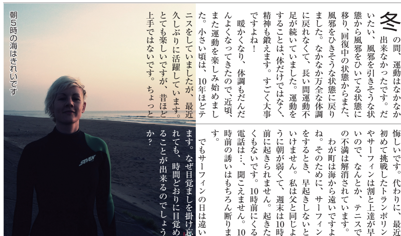
朝5時の海はきれいです

冬 の間、運動はなかなか 出来なかつたです。だ いたい、風邪を引きそうな状 態から風邪をひいてる状態に 移り、回復中の状態からまた 風邪をひきそうな状態に戻り ました。なかなか万全な体調 に戻れなくて、長い間運動不 足が続いていました。運動を することは、体だけではなく、 精神も鍛えます。すごく大事 ですよ! 暖かくなり、体調もだんだ んよくなってきたので、近頃、 また運動を楽しみ始めまし た。小さい頃は、10年ほどテ ニスをしていましたが、最近 久しぶりに活躍しています。 とても楽しいですが、昔ほど 上手ではないです。ちょっと 悔しいです。代わりに、最近 初めて挑戦したトランポリン やサーフィンは割と上達が早 いので、なんとか、テニスで の不満は解消されています。 わが町は海から遠いですがよ ね。そのために、サーフィン をするとき、早起きしないと いけません。私は父と同じよ うに朝が弱くて、週末は10時 前に起きられません。起きた くもないです。10時前になる 電話は…、聞こえません。10 時前の誘いはもちろん断りま す。 でもサーフィンの日は違い ます。なぜ目覚ましを掛け忘 れても、時間どおりに目覚め ることが出来るのでしょうか？