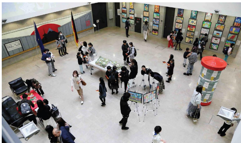
大使館アトリウムでの公開展覧会「オープン・デー」(2025 年)