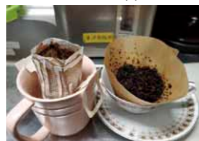
「ドリップしたコーヒー」 (答えは左のページ)