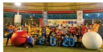
第2回こばやし熱中運動会(令和2年度)

東京2020オリンピック・パラリンピックの感動を小林でも！世代間の交流と住民の運動機会の創出を目指し、「第3回こばやし熱中運動会」を開催します。参加者が競技を創る運動会。競技名だけでは中身がわからないのがこの運動会の面白さ。参加者だけではなく見学者も含めて「みんなで作る運動会」にあなただも参加しませんか。 ◆日時 10月31日(日曜) 13時~16時 ◆会場 生駒高原コスモホール ◆参加費 1千円 ◆問・吉村 090・9584・1836