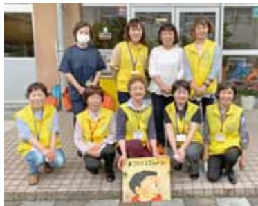
「野尻町絵本の読み聞かせグループたんぼぼ」で活動しているメンバーです

輝けフロンティアのじりの代議員である「野尻町絵本の読み聞かせグループたんぼぼ」の活動を紹介します。野尻町内の小中学校からの依頼で、朝の活動時間や昼休み時間などに読み聞かせを行っています。昨年度から、町内の幼稚園・保育園・認定こども園も対象となり、さらに活動が活発になりました。令和2年度には「(公社)読書推進運動協議会」の優良読書グループとして表彰され、会員の活動の励みになっています。今後子どもたちと触れ合いながら、本を身近に感じ、健やかに心豊かな成長の一翼を担えるよう読み聞かせを行っていきます。