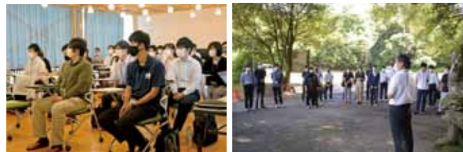
▲8月6日に行われた第1回目の研修とフィールドワークの様子

令和4年度に実証実験に向けて東大先端研や関係者との調整を行い、令和5年度から実証実験を行うことを目指します。