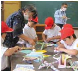
新聞紙の十字けん玉づくり。子どもより大人の方が夢中に！

西小林小学校の空き教室で「茶飲ん場・寺子屋」をはじめて8年。子ども達は、月1回のこの日を楽しみにしているようで、準備しているところ「あつ、今日は茶飲ん場の日だ！」と嬉しそうにしてくれます。大人も、子ども達が来るのを楽しみに待ちます。授業が終わる子ども達がやって来ると、教室はあっという間に賑やかに。折紙や工作、将棋、おはじき、羽根つきなど、それぞれが楽しく過ごします。今の一番人気は、なんと「宿題」です。「放課後子ども教室」は2年目。クチコミで申込多数となり嬉しい悲鳴をあげています。参加者が決まっているため、じっくり取り組める内容にしています。