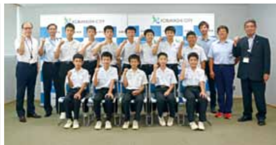
小林中男子ハンドボール部