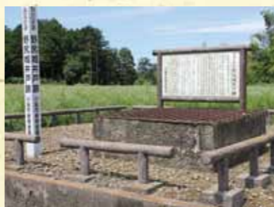
① 野尻城縄張り図(野尻町史より抜粋) ② 野尻城井戸跡

野尻城は、野尻町市街地の南方の台地上に立地し、北～東方には城之下川と呼ばれる小河川が流れています。南北400m、東西800mにおよぶ広大な城域を有する城郭で、「本城」と称される部分と「新城」と称される部分に分かれています。