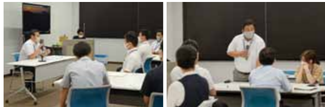
▲8月18日に行われたプロジェクトチーム会議の様子

このプロジェクトでは、4人ごとに「健康・福祉」、「人材育成」、「産業振興」、「まちづくり」のグループに分かれ、これまでの業務で感じた課題などの解決を目指します。早ければ、令和3年度中には東大先端研と連携して実証実験を始める予定です。