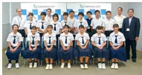
小林中陸上部、テニス部、柔道部