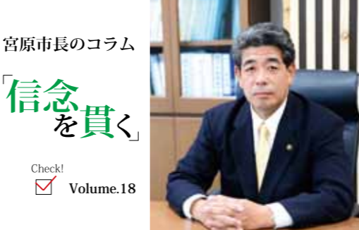
宮原市長のコラム 「信念を貫く」 Check! Volume.18

平成29年7月末のえびの市の民間医療機関の分娩休止を受け、西諸2市1町を挙げて産婦人科医師確保に努めてまいりました。関係者の多大なる努力とご支援を受けて平成30年7月に市立病院に待望の産婦人科医師が着任。平成31年1月からの分娩再開を喜んだことを鮮明に覚えております。あの日から3年、この地で事故なく2000人を超える新たな生命が誕生したことは大きな喜びであります。勤務いただいた医師を中心に、県、宮崎大学をはじめ、市立病院勤務医師、助産師などの関係各位のご尽力のたまものであると心から感謝申しあげます。分娩再開後も、安心・安全な分娩を365日24時間体制で維持するためには、産婦人科と麻酔科の医師が複数名必要であることから、病院事業管理者を先頭に医師確保に務めてまいりました。しかし、全国的な医師不足によりその確保は困難であり、現状のままお産を継続することは母子に対するリスクが高いことから、妊婦と胎児の安全を最優先に考え、断腸の思いで産婦人科の休診を決断いたしました。今後とも西諸2市1町が一体となり、関係機関・団体と連携しながら、安心・安全な医療提供体制を構築すべく努力してまいります。市民の皆さまには、大変なご不便をおかけしますが、ご理解をお願いいたします。