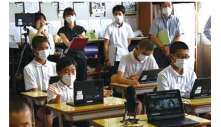
6年吉ノ園絆さんは「古墳の形や埋葬品から、いろいろな地方の文化と積極的に交流・交渉することに長けていたことがわかった」と感想を述べました

7月14日、東方小学校で地元文化財の価値・魅力を見直すことを目的とした、オンライン授業が行われました。6年生が二原遺跡について事前に調査・考察した内容を、県埋蔵文化財センターに発表。発表後は同センター職員(谷口さん)から詳しい解説があり「着眼点・考察ともに鋭いもので、よく調べられています」と講評がありました。