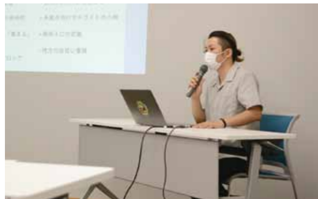
池上隊員は卒業後も市内に定住。得意とする動画撮影・編集を活かした魅力発信や人材育成、関係人口の創出をおとて市の活性化のために活動します