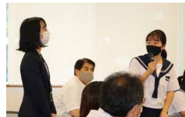
質疑応答の時間では、生徒たちは客室乗務の仕事の魅力について理解を深めていました