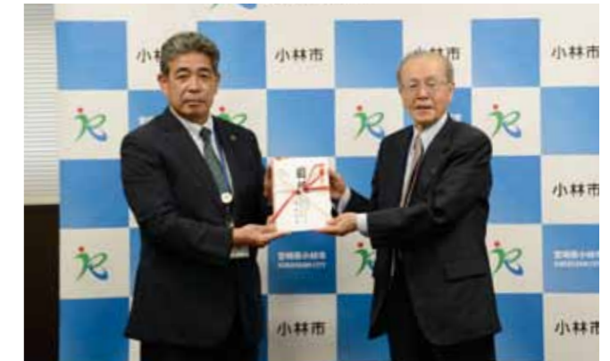
クリーン・アクア・ビバレッジからは、2015年から毎年寄付をいただいでおり、今年で7回目になります。寄付金は施策の推進に活用されます