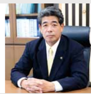
宮原市長のコラム 「信念を貫く」 Check! Volume.17

全国的に新型コロナウイルス感染症拡大が進む中、5月11日には平年より19日早く九州南部地方が梅雨入りしました。昨年も台風や豪雨により全国的に大きな被害が発生しました。人吉地方では、線状降水帯が停滞して記録的な雨量となり、その影響で多くの方々が犠牲となるなど甚大な被害となり、復旧の途上にあります。現在、人吉市・益城町の復旧支援として、職員を派遣し対応しております。復旧作業は、感染拡大防止と同時並行での対応となりますが、一日も早い復旧復興を願うものです。梅雨の影響により市民の生命財産に大きな被害が出ないことを願うものでありますが、災害はいつでも発生するかわりません。人的被害が発生すると想定される場合、早期に避難所を開設するなど対応し、同時に密を避けるなど新型コロナウイルス感染症対策を施して対応してまいります。市民の皆さまにおかれましても、防災ラジオなどを活用し、まずは自分の命は自分で守る気持ちを忘れずに初動対応をお願いします。