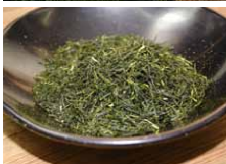
写真 ①一番茶収穫前の茶園。約4畝の畑でお茶の栽培を行っている ②茶葉を加工した荒茶。製茶工場には香ばしい匂いが漂う