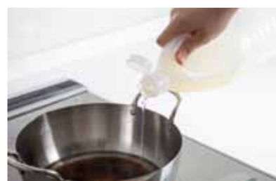
「サラダ油などの 植物性廃食用油の出し方」 (答えは左のページ)