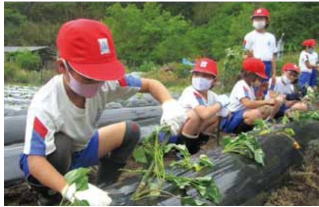
児童・園児たちは「秋になったら収穫して、おいしい焼き芋を食べることが楽しみ」と話していました