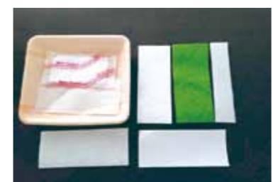
「肉や魚に敷いてある吸水シート」(答えは左のページ)