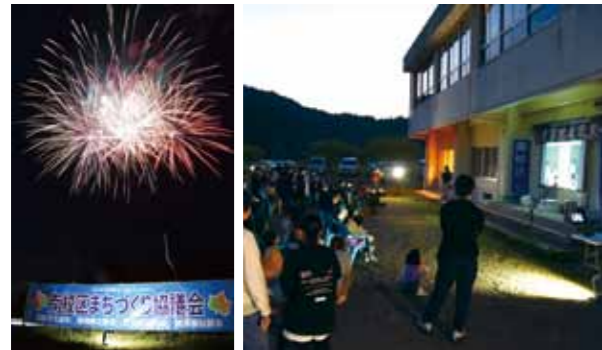
花火と6年間の思い出をまとめた写真スライドショーを観賞しました