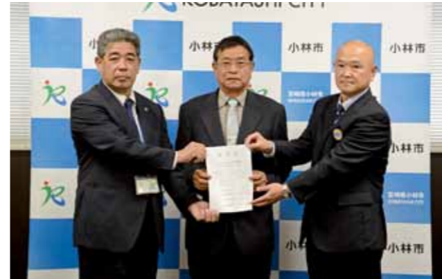
河野会長(写真中央)は、「会員は70代が中心だが、できる範囲で活動を行って、安心・安全で住みよい地域を守っていききたい」と話していました