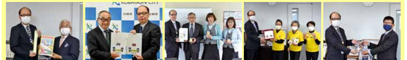
小林地区交通安全協会と県交通安全協会より反射タスキと下敷き