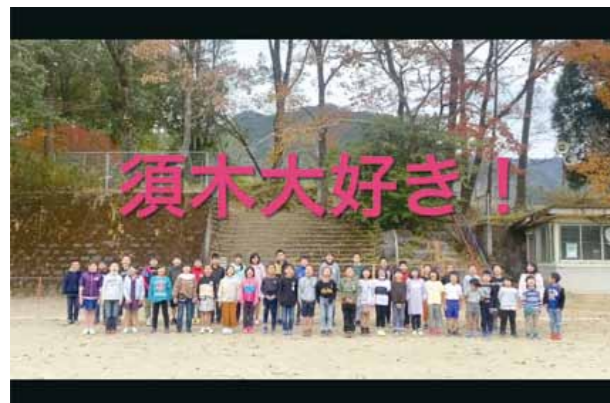
動画は「イベント」「スポット」「食」「人」の4つのテーマに分けて、それぞれ須木の魅力を紹介しています

須木小学校では、今年3月に卒業した6年生児童4人が制作した、須木のPR動画を学校ホームページで公開しました。児童は総合学習の時間を使って「須木地区の未来のために、自分たちができることは何か」を検討。約10か月かけて児童自らが取材し、タブレットを使って編集を行いました。