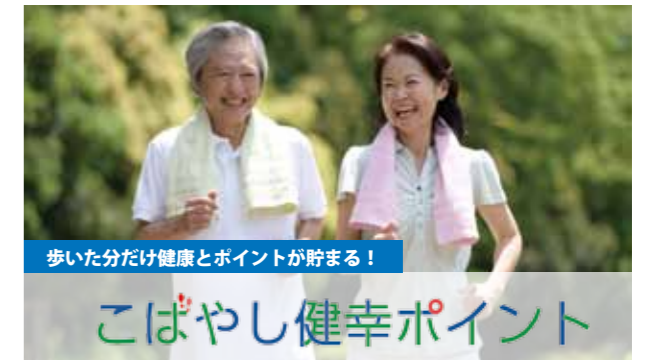
歩いた分だけ健康とポイントが貯まる!