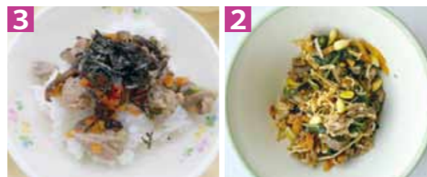
1デザートで提供されたマンゴー 2宮崎牛のビビンバ 3地頭鶏の照り焼き丼