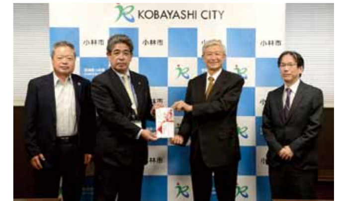
いただいた寄付は、東京一極集中を是正するための地方での人材育成の取り組みを加速させるための活動に使われます