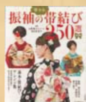
『振袖の華やか帯結び 250選』 監修：山野愛子ジェーン、 安田 多賀子 発行：世界文化社