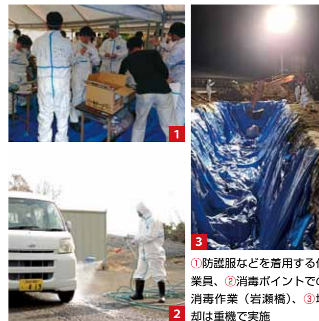
①防護服などを着用する作業員、②消毒ポイントでの消毒作業(岩瀬橋)、③埋却は重機で実施