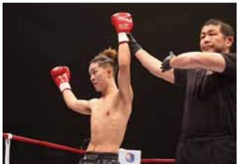
▲11月3日に行われたプロ2戦目の様子。相手を圧倒し、1R 2分6秒でKO勝ちを決めた

空手で鍛えた両脚の蹴りを武器にめきめき頭角を現し、日本有数の規模を誇るK-1ジムからスカウトされ、昨年4月にフェザー級（157・5ポンド）でプロデビューを果たした。