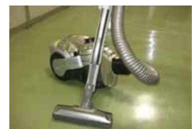
「掃除機、ラジオ・ラジカセ、ドライヤー」(答えは左のページ)