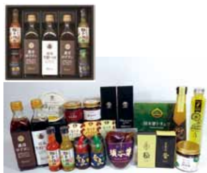
須木の魅力がたっぷり詰まったギフトセット

すきむらづくり協議会とすきブランド協議会が連携し、須木の特産物である栗、柚子のブランド商品を組み合わせた「すきブランドギフトセット」の販売を行います。この取り組みは新型コロナウイルス感染症により、イベント開催や物産販売などが減少していることを受け、インターネット販売を中心に、ギフト販売を展開し、所得の安定化や販路拡大を図っていくものです。今後も須木地域一体となつて、自主的で活気あふれる持続可能な「すき」を目指した地域づくりを行ってまいります。