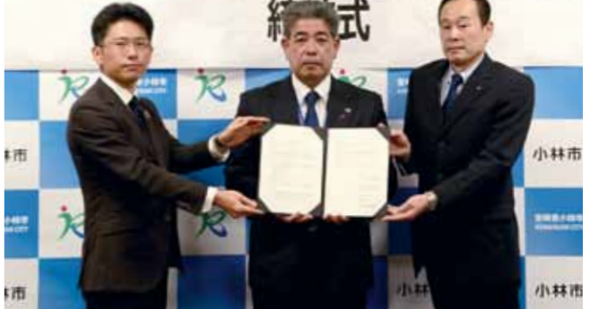
第1期協定では、City Wi-Fiの構築や光ファイバー網整備などを推進。第2期協定では、情報基盤の更なる充実と効果的な利活用を目指します。