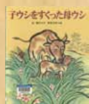
『子ウシをすくった母ウシ』 文：谷 真介 絵：赤坂 三好 発行：佼成出版社