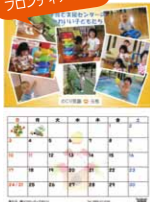
子どもたちの笑顔がいっぱいのカレンダー