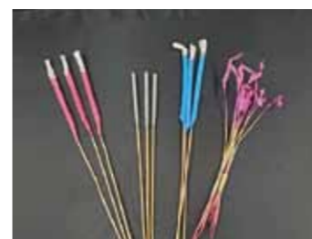
「花火」 (答えは左のページ)