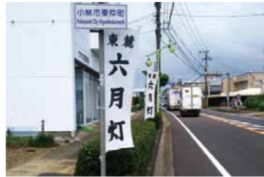
野尻町中心部に六月灯ののぼり旗を設置しました

五穀豊穡、牛馬を疫病から守る六月灯まつりは、野尻町故郷に夏の到来を告げる伝統行事として引き継がれ大切に守られてきました。 本年は野尻小学校児童による灯籠の作成や同校体育館をメイン会場とした歌や踊り・抽選会等のイベントは中止となりましたが、六月灯の季節を感じて頂くためののぼり旗を7月15日～8月1日の間、町の中心部に設置しました。 夏の猛暑とコロナで少々疲れぎみの住民の皆さんに一服の清涼剤として明るい話題を提供できました。