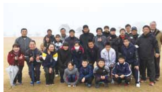
写真は総会資料に使われた、こばやし駅伝大会の様子です。今後の須木地区の活躍をお見逃しなく！！

令和2年度より、すきむらづくり協議会の役員もニューフェイスが加わり、より活気が出ていくと見込んでいます。新体制に先立ち、新しい部会も設立されました。現在ある、部会と共に須木を盛り上げていく部会は「未来づくり部会」。 須木地区が抱える喫緊の課題解決に取り組み、誰でも住みたくなり、住み続けられる地域づくりを目指すため、中・長期的な戦略を構築し、未来を担う子ども達が望む理想の須木地区の未来をつくり上げようという部会です。