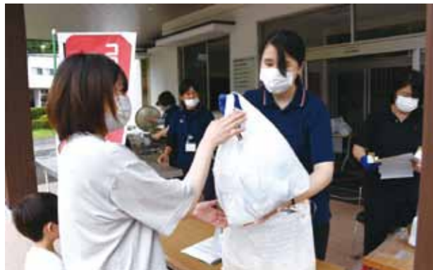
個人47人と企業を含めた33団体から、米、野菜、即席麺や調味料など多くの食品などが寄贈されました