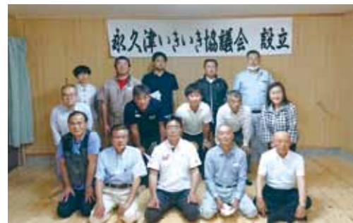
運営委員メンバーです。感染症の影響で書面での決議となりましたが、よろしくお願いたします。

私たちが住む永久津校区は、小林市北部に位置し、豊かな自然に恵まれた農畜産業が盛んな地域です。地域の伝統を大切に継承しつつ、皆で支え合いながら今に至っています。