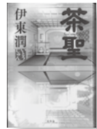
「茶聖」 著者：伊東 潤 発行：幻冬舎