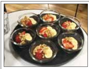
試食用のアサイーボウル

着任から1年半。子ども たちも学校や保育園に慣 れ、楽しく過ごしています。 去年は「食と柔術で知る ブラジル」というイベント を開催し、ブラジル文化の 紹介や、小林の果物をトッ ピングしたアサイーボウル の試食を行いました。 現在は、カルチャースク ール・柔術道場を開く準備 として、夫と一緒に柔術体 験を行っています。子ども に英語の読み聞かせをする 活動も企画中で、子どもか ら大人まで、楽しく、新し いことに挑戦できる環境を 作っていききたいです。