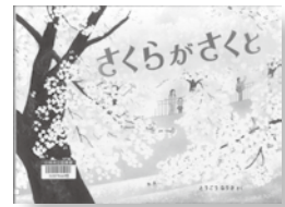
「さくらがさくと」 さく：とうごう なりさ 発行：福音館書店