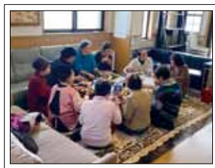
いきいきサロンの様子

小林に来て半年が過ぎま した。皆さんの温かいご支 援とご協力をいただき、心 から感謝いたします。 現在、地域住民同士の繋 がり深めてもらう場をつ くるために、社会福祉協 会・福祉法人と連携しなが ら、いきいきサロンの運 営を手伝っています。 休日には、須木地区での 買い物支援を目的として、 自主的に日用品の移動販売 を行なっています。 もし私のことを見かけた ときには気軽にお声がけく ださい。これからもよろし くお願いします。