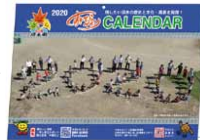
今年のカレンダーも須木の歴史と文化・風景を発信しています

すきむらづくり協議会広報部が主体となり、毎年発行しているカレンダーの紹介をします。 今年も、須木地区の皆様をはじめ、多くの市民の皆様にご購入いただきました。誠にありがとうございました。 内容は、すきむらづくり協議会の活動写真、昔と今の成人式から始まり、須木小学校・保育園の各種行事写真や須木納涼花火大会、地元特産物の栗を使った郷土料理など。また在庫がありますので、購入を希望する人は、すきむらづくり協議会まで気軽に問い合わせください。 ●問・事務局 TEL 48・3451