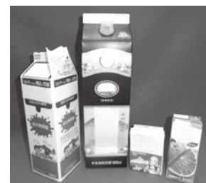
「飲料用の紙パック」 (答えは左のページ)