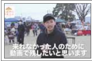
来れなかった人のために 動画を残したいと思います