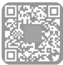
えびの駐屯地公式 twitter