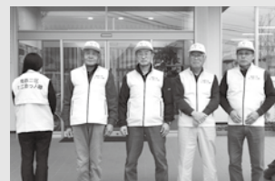
南西二区の「ミニ助っ人隊」のみなさん

有償たすけあいサービスは、ちょっとした困り事(買い物、草刈り、電球交換など)を安価で設定し解決することで、お礼品の準備や授受などの負担を軽減し、住みなれた自宅や地域で住み続けている地域づくりを目的とした取り組みです。