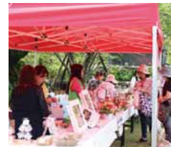
豪華景品が当たるスタンブラリーや楽しいイベントも企画しています

出店者の募集 5月3日開催『のじりローズフェスタ2020 in 大塚原バラ園』に出店しませんか? 詳しくは、実行委員会で問い合わせください。 ●問・大浦携帯 090・1921・8313 防災リーダー養成講座 2月9日、災害時における地域の安心・安全を確保するために『三ヶ野山地区防災リーダー養成講座』を実施しました。公助に頼らない自助活動の必要性とそのリーダーを養成するものです。市危機管理課と協働し組長や公民館長など45人が参加しました。 今後このような事業に積極的に取り組んでいきます。