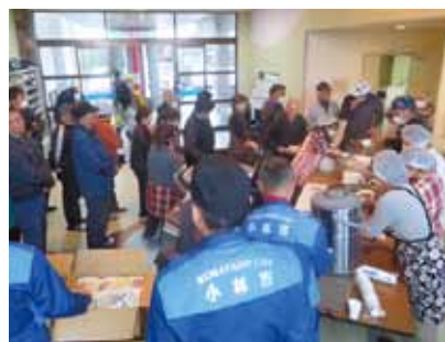
みまつ食堂のメンバーも参加し、チーム自慢のカレーを提供しました