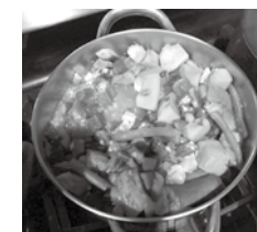
→ ティノーラ ← ピナクベツト

私にとって、小林市は自然あふれるパラダイ スのようです。ここから見る山なみ、田畑、花々、 どれもが素晴らしいです。また、小林市では新 鮮なフルーツと野菜を買いにファーマーズマー ケットに何度も行き、フィリピン料理を作りま した。「アドボ」(ビネガー、ニンニク、醤油、 ローリエと粒コショウで味付けしたフィリピン 風・鶏肉または豚肉の角煮)、「ティノーラ」(鶏 肉とハヤトウリのシチュー)、「ピナクベツト」 (季節の野菜と小魚の塩辛)の食材も、ファ ーマーズマーケットで買えます。