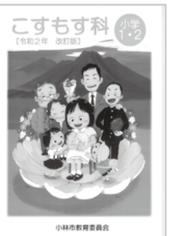
刷新された教科書(写真は小学1・2年生用)

改訂版「こすもす科」は、小林市教育研究センターに所属している市内の先生方が作り直しました。新学習指導要領では、「社会に開かれた教育課程」がキーワードとなっています。例えば、地域の方が授業の講師となって話をしたり、技術の伝統を行ったりします。そうする