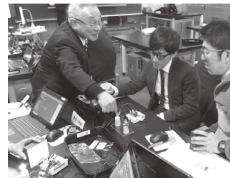
タブレットやロボットの操作練習をしている様子

2月4日、小林小学校にて、小学校の先生を対象に、プログラミング学習の体験研修を行いました。まずは、触ってみることが大切で、先生たちも楽しんで操作していました。