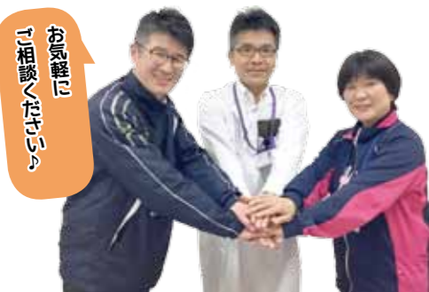
お気軽に ご相談ください

認知症初期集中支援チームは、認知症についての困りごとや心配ごとなどの相談に対応するチームです。対象となる人は自宅で生活している認知症の方や認知症が疑われている方で医療サービス、介護サービスを受けていない方、または中断している方などです。認知症は誰もがなる可能性があります。早めの対応が必要です。ひとりで抱え込まず、まずは地域包括支援センターなどにご相談ください。