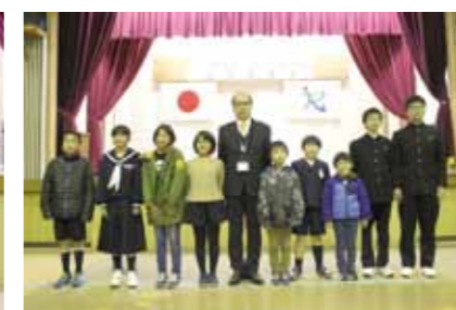
家族の作文の受賞者の皆さん