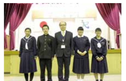
善行青少年の受賞者の皆さん