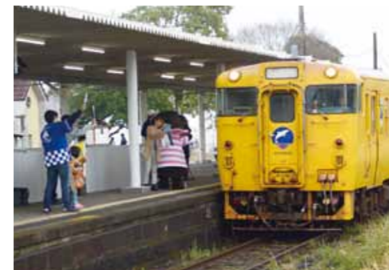
参加者は、宮崎駅からの臨時列車に乗り来市。小林産の食材を使った料理を味わいながら列車の旅を堪能しました