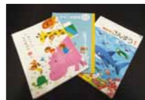
「教科書・ノート類」(答えは左のページ)