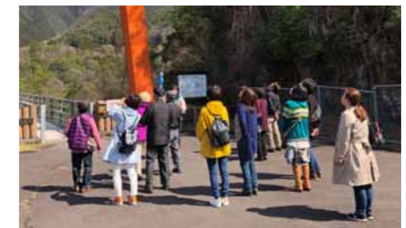
Photo1 須木地区の小野湖の大吊橋からの眺めを楽しむ参加者 2 霧島岑神社では、本殿内部も見学しました 3 自然が生み出した奇石「陰陽石」を見学