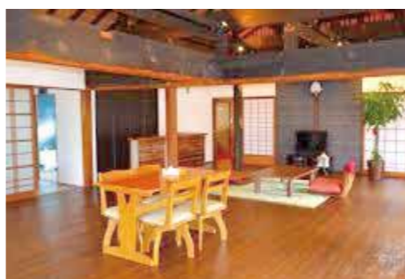
広々としたフロンティア荘のリビング。田舎暮らしや移住に興味のある人にどんどん紹介してください

輝けフロンティアのじりでは、古民家をリノベーションして平成29年11月から移住促進の取り組みを進めています。施設の名称は「フロンティア荘」です。家庭菜園が体験でき収穫もできること、また、約32畳の広いリビングがあることもフロンティア荘のユニークな特徴です。本年度は既に7組の申し込みがあり滞りなく移住が実現しています。現在具体的に移住を検討されています。これから、自然あふれる野尻にしかない魅力を創り出し、移住促進と定住に取り組んでまいります。