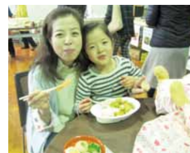
会場を訪れた人々からは、「カレーライスおいしいね！」と好評でした

2月23日に西小林地区公民館にて、2か月に1回開催されている「西幸夜市」と「にっこばふれあい食堂」が行なわれました。2月にしては暖かく、多くの人でにぎわいました。地元の野菜や漬物、お菓子、雑貨などのお店が、女性部会の「にっこば工房」による煮物やおにぎりも人気で完売。一晩だけの本屋さんコーナーは小学生出店の本屋さん大人気でした。また「にっこばふれあい食堂」では、毎回カレーライスと小さなおかずを提供しています。ガスで炊いたごはんもおいしいと評判です。4月から2か月に1回開催する予定です。お楽しみに！