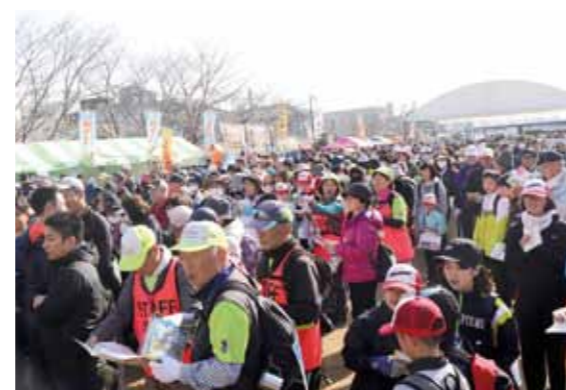
同大会はスポーツ振興くじ助成金を受け開催。参加者は、地域住民のおもてなしを受けながらウォーキングを楽しんでいました

2月23、24日に「第21回みやざきツアーデーマーチ・こばやし霧島連山絶景ウォーク」を開催しました。北海道から沖縄まで、2日間で2162人が参加。参加者は、出の山公園や生駒高原、陰陽石、三之宮峡など市内の各観光名所を巡る6キロから30キロの8つのコースを歩きました。