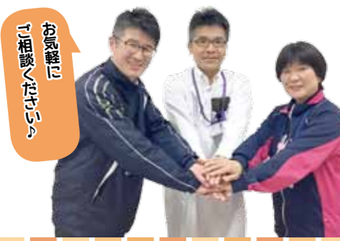
お気軽にご相談ください

認知症初期集中支援チームは、認知症についての困りごとや心配ごとなどの相談に対応するチームです。対象となる人は自宅で生活している認知症の方や認知症が疑われている方で医療サービス、介護サービスを受けていない方、または中断している方などです。認知症は誰もがなる可能性があります。早めの対応が必要です。ひとりで抱え込まず、まずは地域包括支援センターなどにご相談ください。