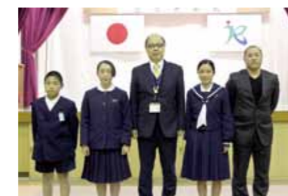
青少年健全育成標語の受賞者の皆さん

善行青少年は、地域社会において他の模範となる優れた行為・活動を行った青少年を表彰するものです。今回は個人3名、団体1団体が推薦されました。