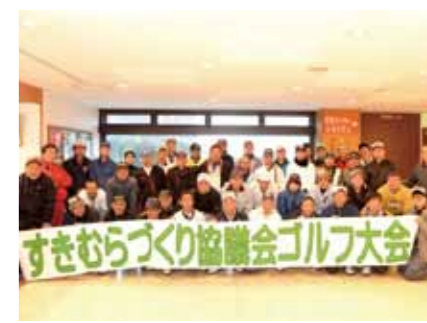
団体賞や個人賞を数多く受け、表彰が行われた懇親会は大変盛り上がった有意義な会となりました

3月10日に、ジェイズカントリークラブ小森コースで、第1回すきむらづくり協議会ゴルフ大会を開催しました。当協議会では2年に一度須木区域全体の運動会を行っています。その間となる年は、ソフトボールやミニバレー大会を開催していました。今回、ソフトボール大会に代わる企画として、親睦と融和を目的にゴルフ大会を開催したところ、すきむらづくり協議会会員の老若男女46人が参加。当日は、あいにくの雨模様で肌寒い中でしたが、好評で、珍プレーが続出し和気あいあいとした楽しい一日となりました。