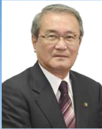
市長 肥後 正弘