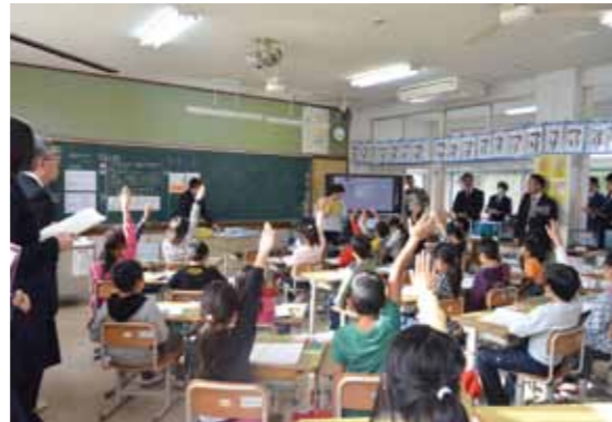
平成27・28年度に、課題解決型授業（アクティブ・ラーニング）推進校に指定された野尻小学校で、算数科の授業を公開