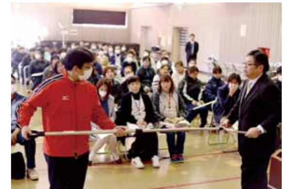
実技指導を行う参加者。今回の講習会は、神奈川県で発生した障害者施設での殺傷事件を受けて開催されました