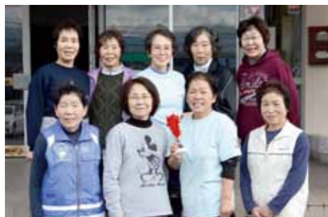
小林インディアカ同好会の皆さん