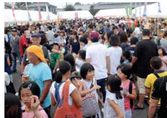
多くの人で賑わう中央商店街。会場では、小林秀峰高のウエイトリフティング部、新体操部、ハンドボール部の実演も行われました

9月5日、こばやし祇園祭土曜夜市が中央通商店街で開催されました。地域の活性化につなげようと、中央通商店街振興組合と商工会議所青年部が52年ぶりに「祇園祭」を開催。ハワイ旅行が当たる大抽選会、屋台村、ビアガーデンやステージイベントが行われ、会場は多くの人で賑わいました。