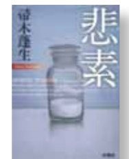
『悲素』 著者：帯木 蓮生 発行：新潮社