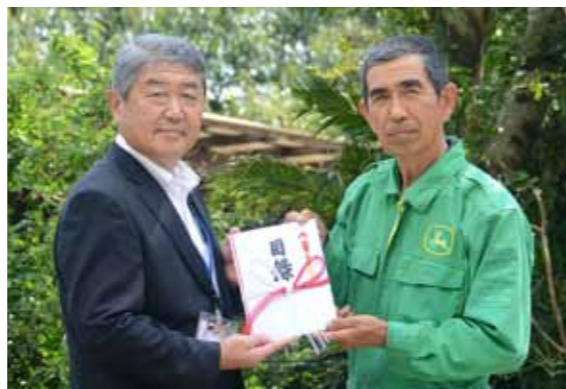
寄附金は、関係機関を中心に組織する検討会議で具体的な子どもの貧困対策施策を策定し、その活用を図っていきます