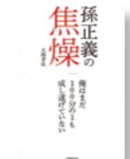
『孫正義の焦燥俺はまだ100分の1も成し遂げていない』 著者：大西 孝弘 発行：日経BP社