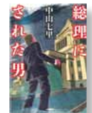
『総理にされた男』 著者：中山 七里 発行：NHK出版