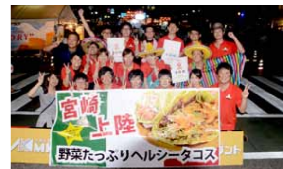
スタッフでの記念写真。準優勝の副賞として、ラジオのスポットCM 100本などをいただきました

アサヒビールプレゼンツご当地グルメコンテスト in まつり宮崎が、8月22日、MRTmiccで開催され、市の「野菜たっぷりヘルシータコス」が準優勝を獲得しました。本事業は、4月から3年目の市職員が研修の一環で実施。「世界のビールとレストラン sunny side」や「パン工房アラジン」などの協力をもらい、メニューの考案、PR活動や祭り当日の準備、運営などを行ってきました。このタコスは、現在、sunny side で商品化・販売されています。