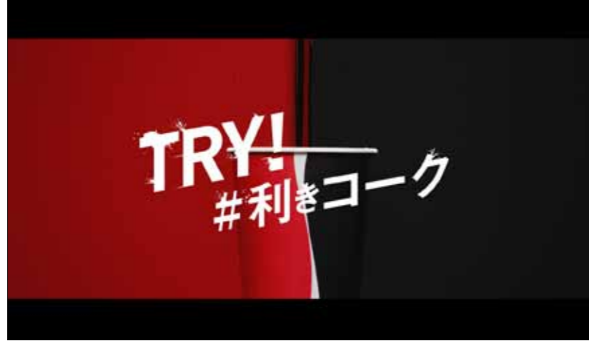
代表作 / TRY! 利きコーク / コカ・コーラ ゼロ (日本コカ・コーラ)