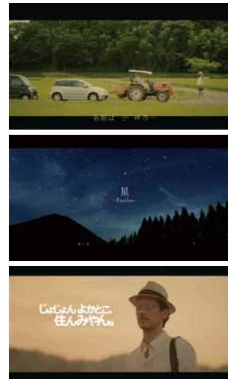
映画のような映像美で小林市を紹介する「ンダモシタン小林」

話題になっている今、市民や出身者の一人一人がそれぞれの立場で、故郷を盛り上げていければいいですね