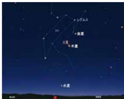
10月17日5時20分ごろの東天

生駒高原を象徴するコスモスが満開を迎えるこの時季は、澄み切った星空に巡り会える機会も多くなってきました。25日まではコスモスマツリ期間。この期間は14時～15時に昼間輝いている星を大型望遠鏡で見えます。また、太陽望遠鏡による驚きの太陽表面も見逃しません。10日(土曜)19時30分～21時は恒例の『星空の夕べ』。ギターを使っての弾き語りやインストウルメンタル。そして、自然の星空を星のソムリエ