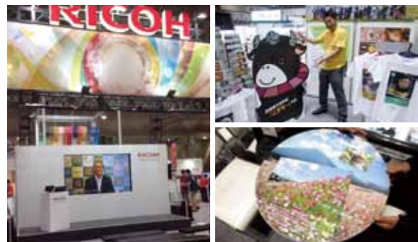
(左) メインステージでは市のPR動画が放映 (右) 小林市のコーナー (右下) 装飾テーブル

東京ビックサイトで9月11日～16日に開催された「IGAS2015 (国際総合印刷機材展)」で、リコージャパン(株)の計らいにより、小林市のPRが行われました。同社ブース内に、小林市の魅力やふるさと納税などを紹介するスペースを設置。同社製の最新機材によって、小林市の四季が印刷されたテーブルや、「西諸弁ポスター」がプリントされたTシャツなどが展示されました。