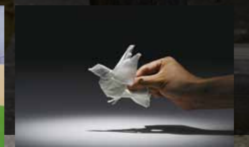
代表作 / Tissue Animals (ネピア)