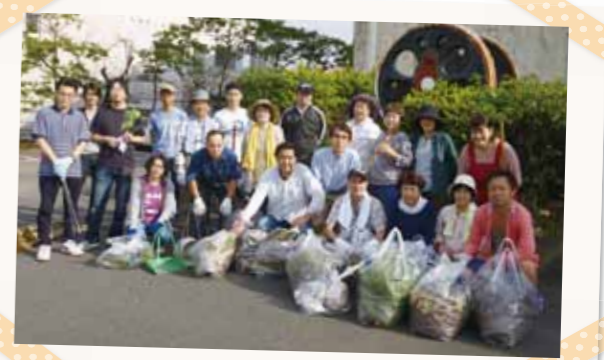
小林支部理容組合の皆さん