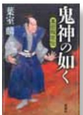
『鬼神の如く 黒田叛臣伝』 著者：粟室 麟 発行：新潮社