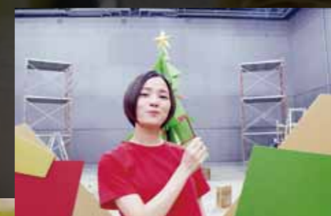
代表作 / Crisp Concert (グリコ)

細野出身。昭和55年1月生。南小、小林中、小林高校を卒業。九州芸術工科大学(現九州大学芸術工学部)画像設計学科・大学院卒業後、(株)電通に入社。コピーライターやCMプランナーを経て、CDCコミュニケーション・プランナーに。これまで、ソニー、キャノン、ホンダ、ドコモ、ネピア、コカ・コーラなどを担当。手がけた作品が国内外で多数受賞。