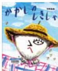
『かかしのはやし』 作者：中野 真典 発行：理論社