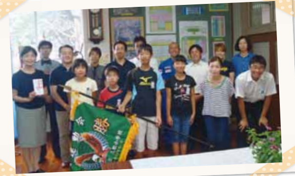
昭和61年度三松小卒業生と同小教諭・児童の皆さん