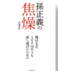
『孫正義の焦燥俺はまだ100分の1も成し遂げていない』 著者：大西 孝弘 発行：日経BP社