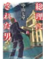
『総理にされた男』 著者：中山 七里 発行：NHK出版