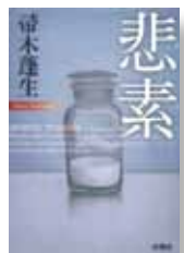
『悲素』 著者：帯木 遼生 発行：新潮社