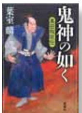
『鬼神の如く 黒田叛臣伝』 著者：葉室 麟 発行：新潮社