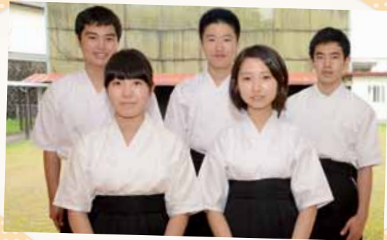
小林高校弓道部の皆さん