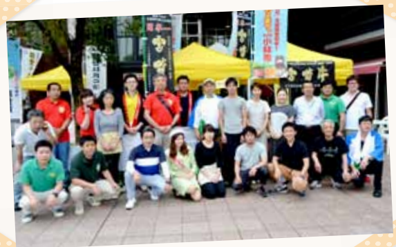
姉妹都市合同物産展 in 金沢に参加した皆さん