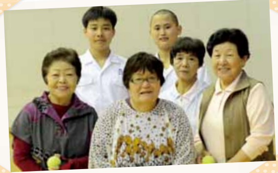
須木中3年生と地域の高齢者の皆さん