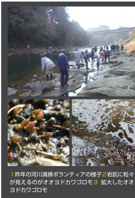
1 昨年の河川清掃ボランティアの様子 2 岩肌に粒々が見えるのがオオヨドカワゴロモ 3 拡大したオオヨドカワゴロモ

オオヨドカワゴロモは、平成11年に新種として発表されたカワゴケソウ科の植物で、小林市の岩瀬川のみで生息している固有種です。見た目には岩場に張り付いたコケと見間違えるくらい姿をしています。かつては、岩瀬川を含む大淀川流域に広く生息していたようですが、昭和30年代以降徐々に建設されたダムや生活排水などが川に流れ込むことによる環境の変化のため、生息地は急激に減少し、現在は岩瀬川のごく限られた場所で見られなくなりました。「ごく近い将来における絶滅の危険性が極めて高い種(環境省レッドデータブック・絶滅危惧ⅠA)」に指定された植物です。