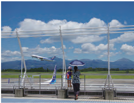
タイトル＝「思い出をのせて」

ある場所。雄大な霧島山を背景に飛び立つ飛行機と、それをさまざまに思いで見送る人々の姿が重なり、霧島市でしか見られない霧島山の特別な表情が生まれます。出会いと別れをそっと見守るふるさとの山が私たちの『霧島山』です」 皆さんも霧島市へお立ち寄りの際は、ぜひ空港から見られる特別な霧島山をご覧ください。