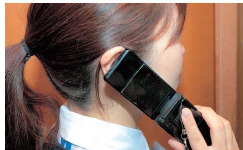
統合型位置情報通知装置の導入で、携帯からの通報でも、出動までの時間を短縮できます。

◎防災無線集中制御装置 火災時のサイレン吹鳴内容を音声合成装置で自動的に作成し、地図上から放送地区を ◎車両運用端末装置 各車両の動態管理及び災害地点までのナビゲーション機能の充実と、各種支援情報データを車両に搭載するとともに、119番通報で受けた現場活動に必要な情報を地図、文字情報により車両で受信できるようにし、災害現場活動をより的確に行い、消防力の強化の一端を担います。 ◎市民案内情報 災害が発生したときに市民の皆さんが災害内容、災害発生場所を確認する為の案内情報です。