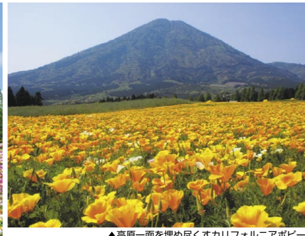
▲高原一面を埋め尽くすカリフォルニアポピー