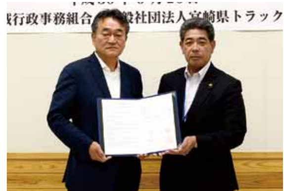
同協会との協定は、県、宮崎県警、宮崎市に次いで4か所目。消防本部に備蓄している3日分の非常食などを輸送します