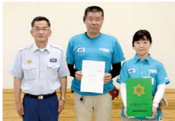
救急車を利用するほどではない医療機関への搬送などで利用したい人は、福祉タクシーきずな（Tel 44 - 2707）へ問合せください