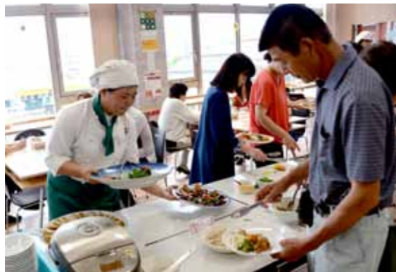
小林西高3年の調理科は22名。5月から準備をはじめて開店を迎えました。来場者は色とり豊かな料理を堪能していました

7月20日、21日、27日、28日に小林西高調理科の3年生が三ツ星レストランをTENAMUビルで開店しました。数種類の新メニューを加えて、地元食材を使った料理をバイキング形式で提供。生徒らは、緊張した様子も見せながらも笑顔で来場者の接客などを行っていました。