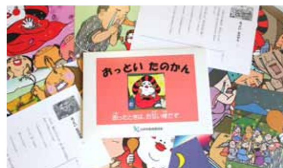
おっといたのかん紙芝居

楽しんで覚えよう 小林の歴史！ 社会教育課では、昨年10月に小林高等学校美術部と市ガイドボランティア協会が手作りで共同で製作・寄贈いただいた「こばやし文化財かるた」と「おっといたのかん紙芝居」を、多くの要望があったため製品化しました。 「こばやし文化財かるた」は市内の文化財のユーモラスな絵に百人一首のようなゲーム性を持たせたかるたです。 「おっといたのかん紙芝居」は江戸時代より続く田の神さあ