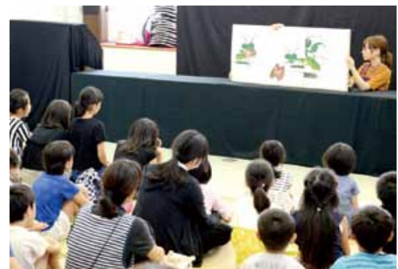
季節ごとに趣向を凝らした内容で実施しているこのイベント。今回は七夕にちなんで、最後に笹飾り作成が行われました