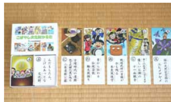
こばやし文化財かるた