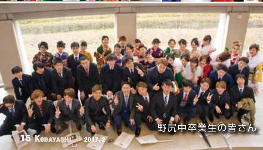
野尻中卒業生の皆さん