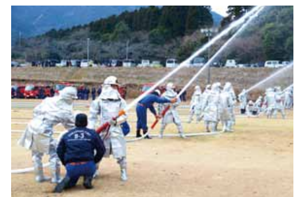
一斉放水をする団員ら。現在、男女問わず団員を募集しているので興味のある人は危機管理課（Tel 23-1175）まで