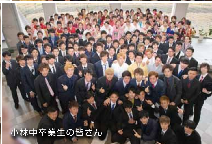
小林中卒業生の皆さん