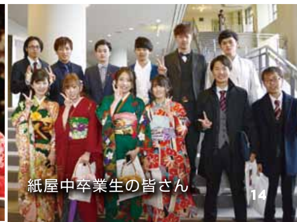
紙屋中卒業生の皆さん