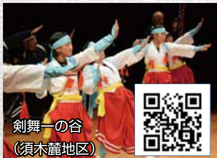
剣舞一の谷 (須木麓地区)