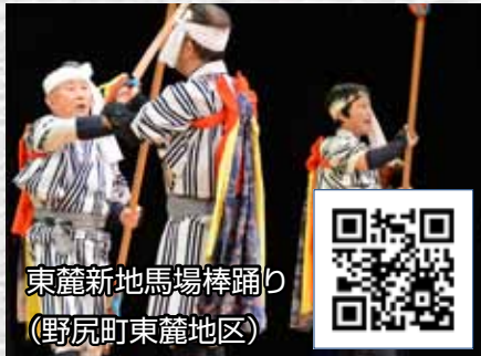
東麓新地馬場棒踊り (野尻町東麓地区)

YouTube 小林市公式チャンネルで、市内 11 の郷土芸能を動画で公開しています。各画像右下の QR コードをスマートフォンで読み取ると視聴できます。ぜひご覧ください。