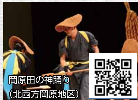
岡原田の神踊り (北西方岡原地区)