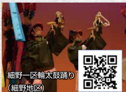
細野一区輪太鼓踊り (細野地区)