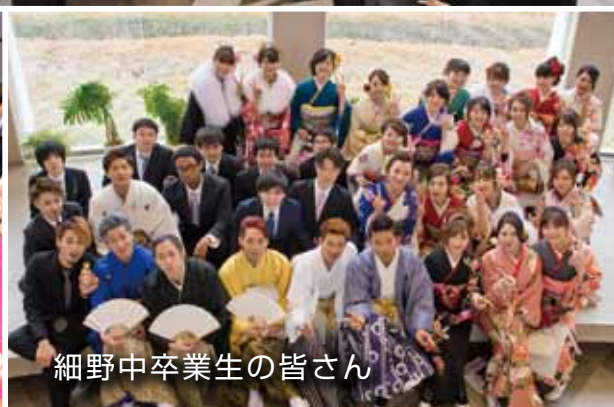
細野中卒業生の皆さん