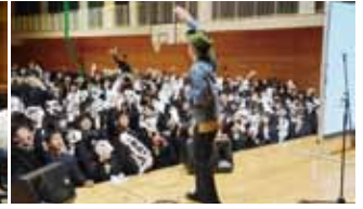
(右上) 小林秀峰高校のワークショップメンバー (左上) 動画はQRコードから視聴できます (右下) 11月25日に行われた楽曲決定ライブ「コバ歌バトル」 (左下) ワークショップの様子