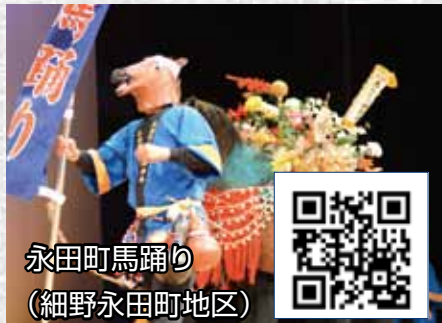
永田町馬踊り (細野永田町地区)