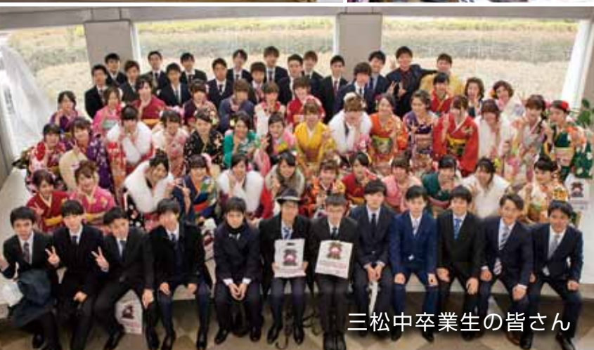
三松中卒業生の皆さん