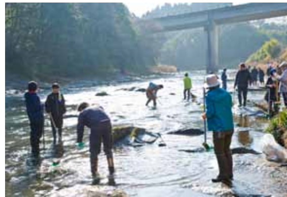
ほうきやブラシを使って、オオヨドカワゴロモの表面をこする参加者。滑りやすい足場に気を付けながら清掃を行いました

1月20日、平成28年3月に国指定天然記念物に指定された「オオヨドカワゴロモ」の自生地である岩瀬川の清掃活動を行いました。土木関係者、小林高校の生徒や市民有志ら約60人が参加。参加者は、オオヨドカワゴロモの生態や表面のゴミのとり方を学びながら清掃しました。