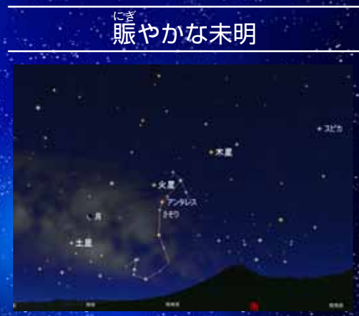
2月11日午前5時40分の南天

明るくなるとうする未明、南天は賑わいを見せています。望遠鏡を通して見ると一層、姿・形が美しい三大惑星がさそり座を中心に集まっています。11日は有明月がにぎわいを添えます。火星がアンタレスに最も接近して見えるのもこの日です。7月末の最接近が楽しみな火星ですが、現在の明るさは1.1等級の1等星。アンタレスも1等星。同じ赤い星同士どちらが明るく見えるか比べてみると面白いです。これから最接近まで赤さが濃くなり、マイナス2.8まで明るくなります。観察を続けると地球と火星が接近していくことを実感できます。夏が楽しみです。 【お知らせ】 今月の観望会は毎週土・日の夜19時～、20時～、21時～。休館は毎週火曜。