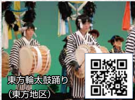
東方輪太鼓踊り (東方地区)