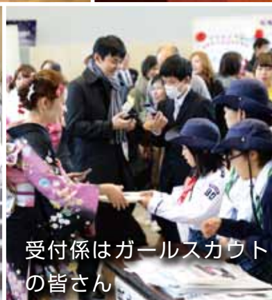
受付係はガールスカウトの皆さん