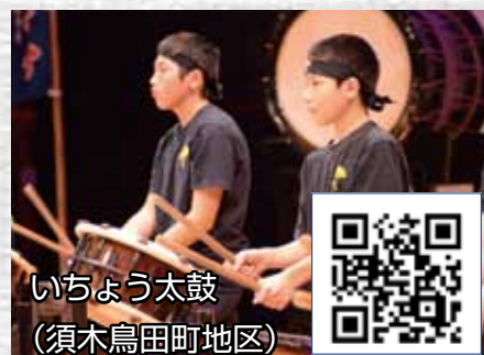
いちよう太鼓 (須木鳥田町地区)