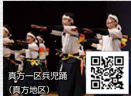
真方一区兵児踊 (真方地区)