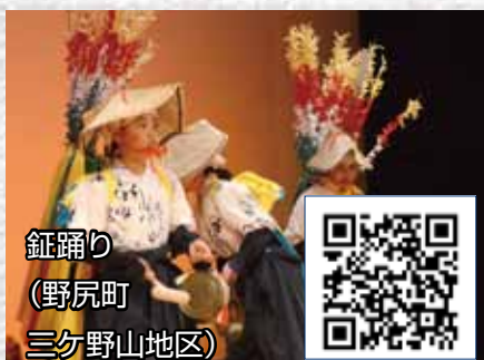
鉦踊り (野尻町三ヶ野山地区)