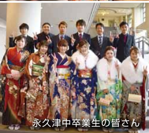
永久津中卒業生の皆さん