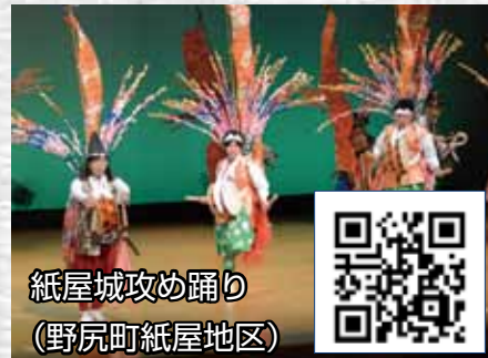
紙屋城攻め踊り (野尻町紙屋地区)