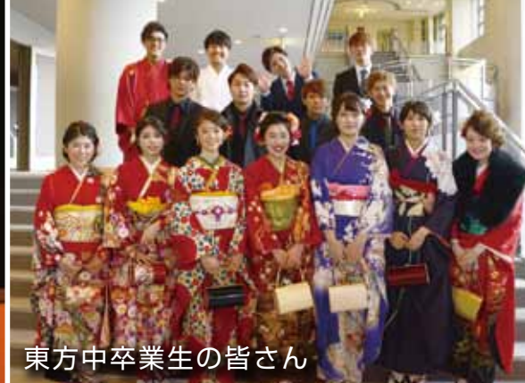
東方中卒業生の皆さん