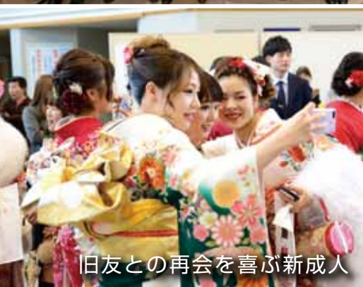
旧友との再会を喜ぶ新成人