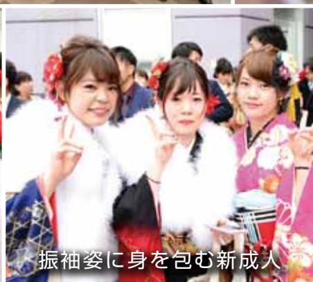
振袖姿に身を包む新成人