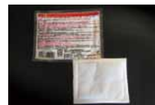
「使い捨てカイロ」 答えは左のページ。