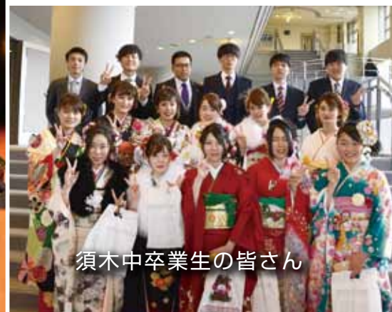
須木中卒業生の皆さん