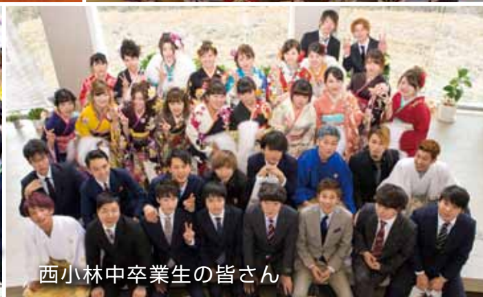
西小林中卒業生の皆さん