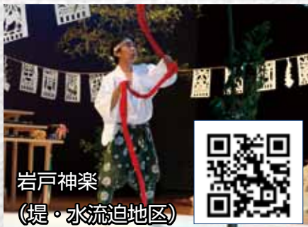
岩戸神楽 (堤・水流迫地区)