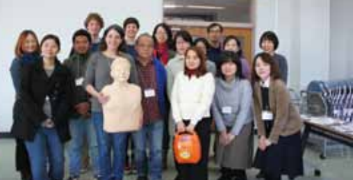
茶道や年賀状づくりなどの日本ならではの文 化体験も。お互いの国の風習について話す ことで異文化理解にもつながっていきます。