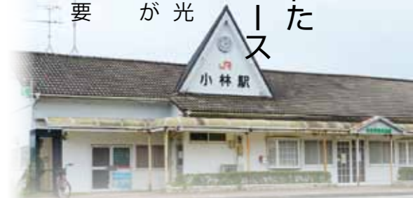
昨年まで利用されていた旧小林駅舎