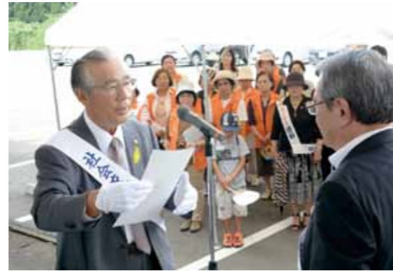
メッセージを代読する窪田会長。非行や犯罪防止のためには、地域のつながりが重要であることを再確認しました