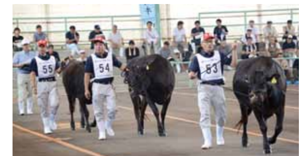
Photo 1 高校生では県勢初の代表となった小林秀峰高校。2 代表の座を獲得した農家の皆さん。3 代表に選ばれた生産者は会場を牛とともに歩き、会場は大きな拍手で包まれていました。