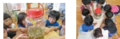
この梅ジュースは、そのまま水で薄めて飲んだり、ゼリーにしたりしていただく予定です。

梅はいつでも子どもたちから観える所に置くことで、「おいしいジュースになあれ!」「おはよう! 元気ですか?」とおいしくなる魔法の言葉をかけてもらっています。ただ今、梅はジュースに変身中です。きっとおいしいジュースになることでしょう。