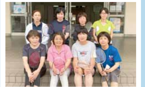
小林シャトルズの皆さん