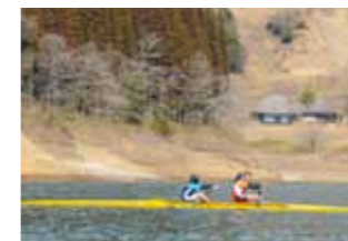
左) 交通や市民の交流の拠点となる小林市地域・観光交流センターイメージ 右) 小野湖でボート競技の大会などを実施します