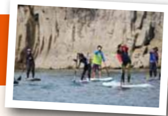
天候もよく、開放的なSUPクルージングを楽しみました。

小野湖は須木地域の貴重な観光資源です。恵まれた自然環境を大切にしながら、交流人口増加を目指します。