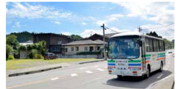
バスの利用促進にもつなげていきます