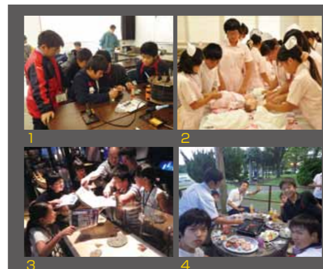
Photo1 小林秀峰高校で行われたロボット作り体験 2 小林看護医療専門学校で行われた看護・医療体験 3 西都原考古博物館で行われた歴史学習 4 石川県能登町で行われた姉妹都市交流事業

地域や学校を飛び出してチャレンジしよう！ 社会教育課では、子どもたちの将来の夢を見つけるきっかけづくりなどを目的に、市内の高校や企業などと連携して、一歩踏み出してチャレンジするための体験活動「グローバルキッズ事業」を行っています。 病院や専門学校での医療や看護の職業体験、高校や博物館、遺跡などでの科学や歴史の専門的な学習体験、外国の文化に親しむ体験活動、地域