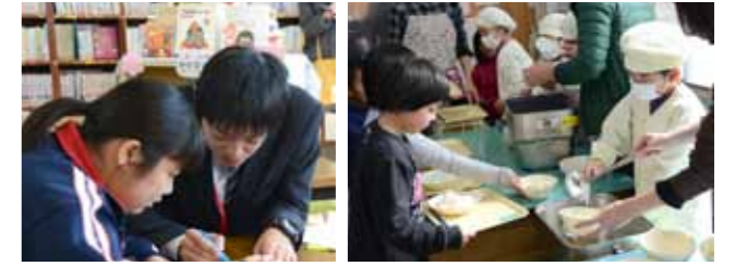
左) 地元企業と連携した職場体験を実施し、キャリア教育を推進します。右) ふるさと納税の寄付金による給食費の半額補助を継続します