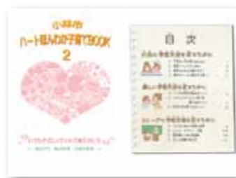
ハートほんわか子育てBOOK2