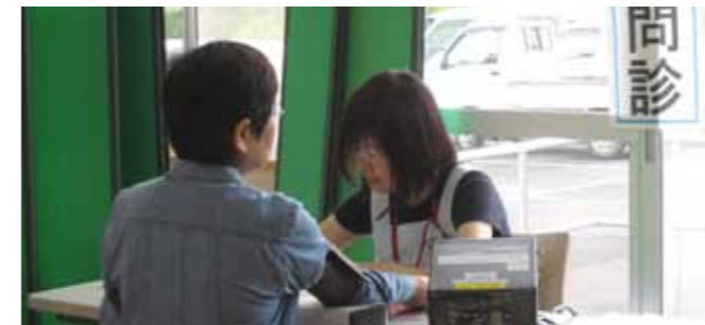
健康意識の向上を図るため、イベントなどで健診コーナーを設置。今後も健康状態を確認する場として活用できる取り組みを進めます