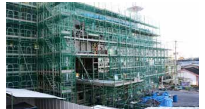
防災拠点としての機能を強化し、開かれた庁舎を建設します