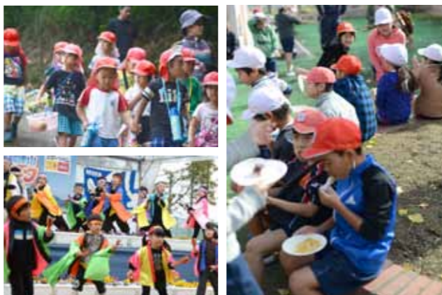
子どもの医療費や予防接種の費用を補助し、地域で見守りながら安心して子育てができる環境づくりに取り組みます