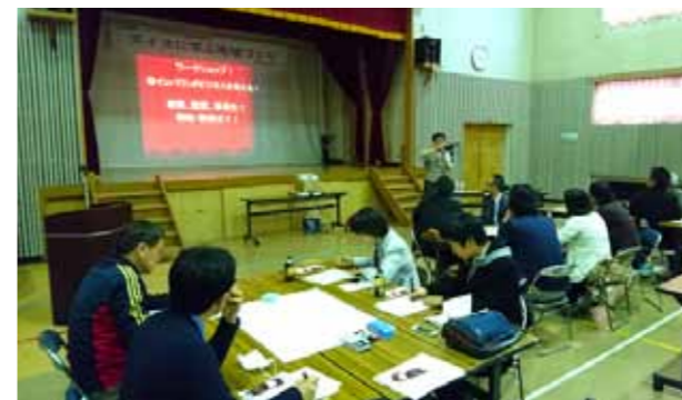
交流の場の創出や人材の育成に取り組む団体を応援します