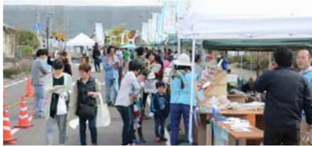
新しいにぎわいの場やコミュニティの場を生み出すこぼやしマルシェ。4月に開催された第3回目は駅南広場で実施