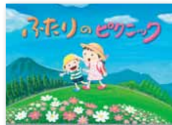
紙芝居「ふたりピクニック」